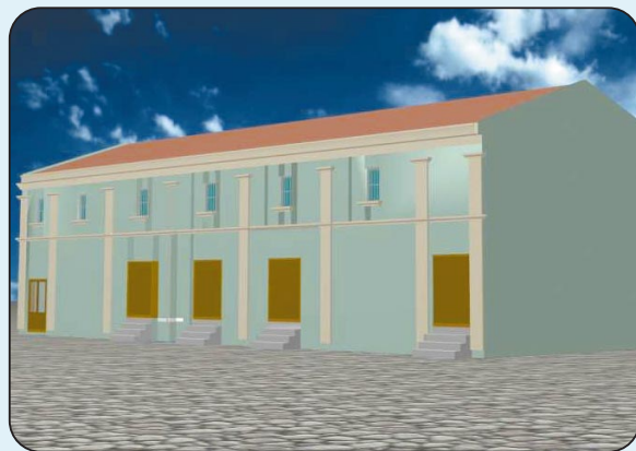
Дел од надворешноста и внатрешноста на идниот Детски театарски центар