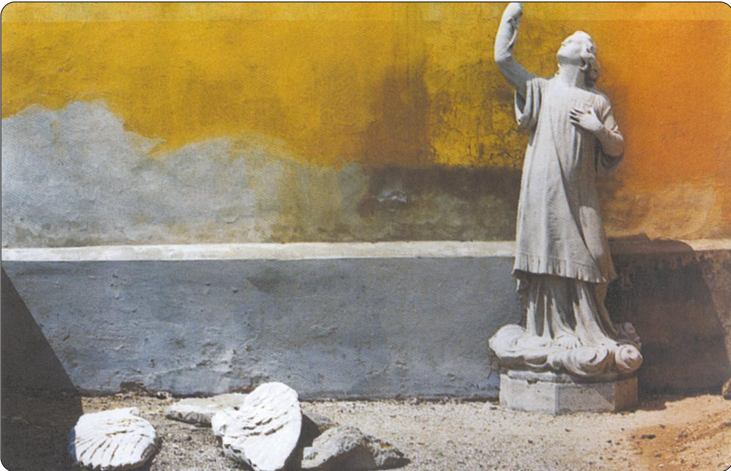
Фотомедија 2002: „The Statue“ Золтан Локос, Унгарија