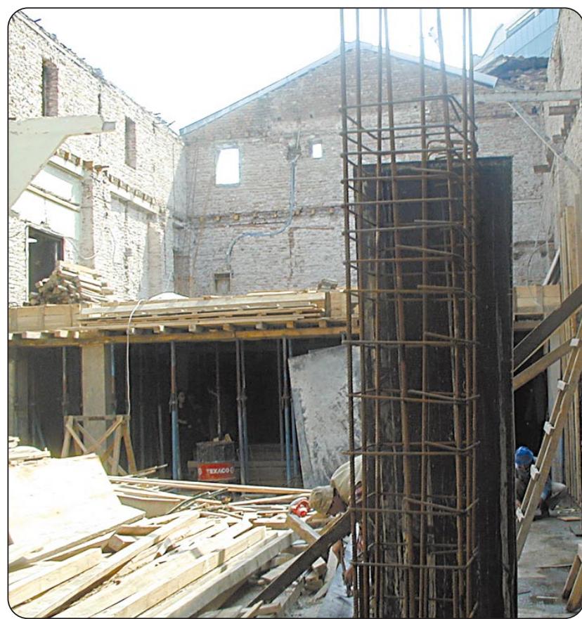
Детскиот театарски центар се гради на темелите на поранешното кино „Напредок“